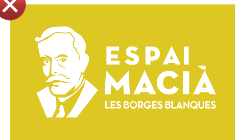
Aplicacio en negatiu en fons de color clar