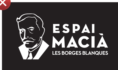
Negatiu fet amb la versió en positiu