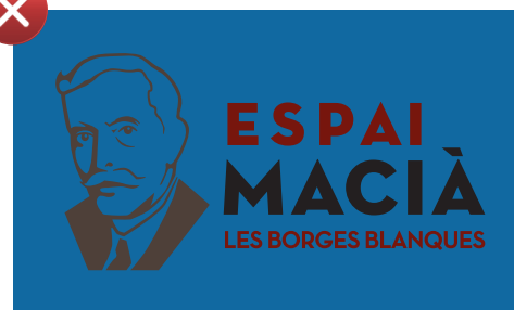
Aplicacio en positiu en fons de color fosc